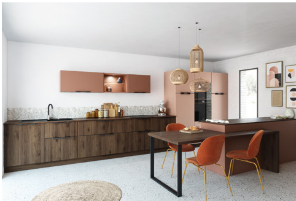
Le nouveau modèle Oasis de You Cuisines et Bains affiche fièrement la poignée profil exclusive Ansyway imaginée par le cabinet français de design C+B Lefebvre et fabriquée par Aluminium Ferri.

Imaginée par le célèbre cabinet français Design C+B Lefebvre et réalisée par Aluminium Ferri pour You Cuisines et Bains, la poignée profil exclusive Ansyway est le fruit d'un processus de réflexion poussé. Nous avons souhaité revenir sur la genèse de cette création.