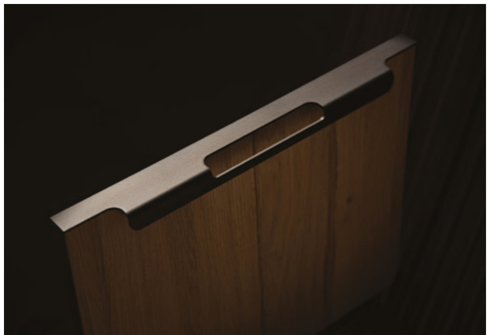
Douce, ergonomique, la poignée profil Ansyway apporte une touche de caractère sans s'imposer.

que l'on cherche dans l'image de l'atelier très à la mode, mais faisant un pas de plus, où plutôt un pas de côté. Nous avons donc imaginé des solutions expressives, à l'opposé du minimalisme moderne, réminiscence des années 50. Nous avons exploré des solutions de customisation attractive. L'objectif général que nous nous sommes donnés pour ce projet